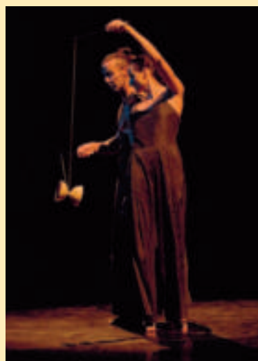
Atemberaubend: Die artistische Darbietung von «Tr'espace» verzauberte das Publikum