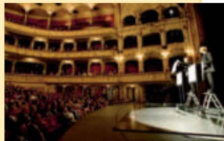
Sagten nichts und sorgten für eine heitere und wortlose Einführung: Das Duo «Ohne Rolf»