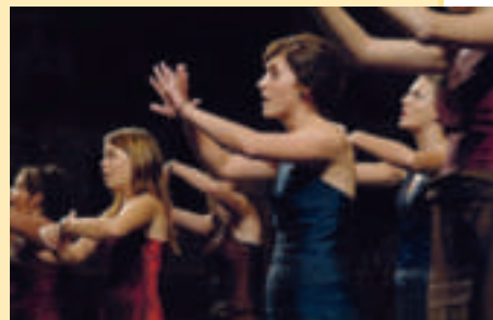
Bildeten den musikalischen Rahmen: Das Vokal-Ensemble «Krambambuli»