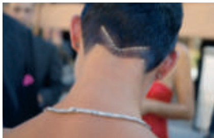
Funkelnde Klunker an Hals und Nacken