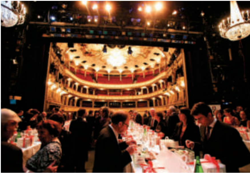
Get together in wundervollem Ambiente im Zürcher Opernhaus