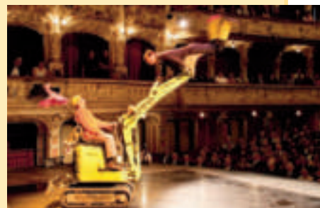
Das Comedy-Duo Lapsus entwischte dem Zirkus Knie und lockte auch gleich ihren mechanischen Elefanten ins Opernhaus