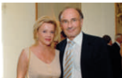
Politprominez: Dr. Felix Gutzwiller